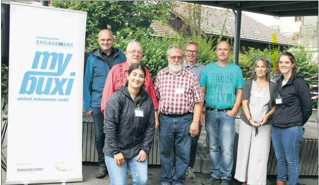
«mybuxi» bietet neu auch in der Region Mobilität im ländlichen Raum.

Referenz: 78129539 Ausschnitt Seite: 2/3